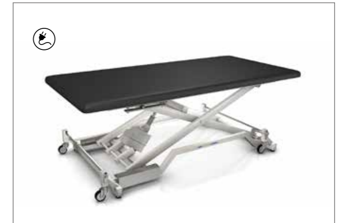
KINGSIZE-SERIE | S. 08