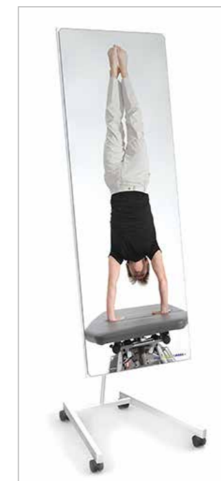
THERAPIESPIEGEL S. 09