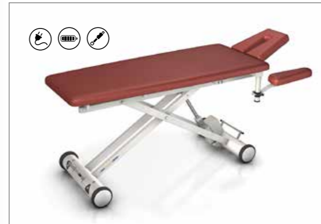
SOLID-SERIE | ab S. 04