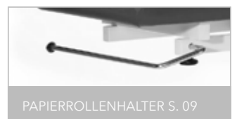
PAPIERROLLENHALTER S. 09