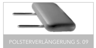
POLSTERVERLÄNGERUNG S. 09