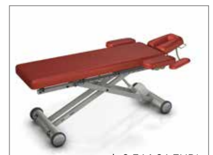
Solid E8/A8/H8 Lymph