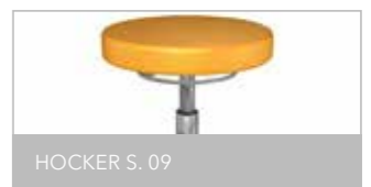
HOCKER S. 09