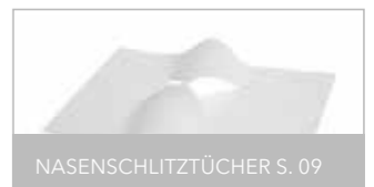
NASENSCHLITZTÜCHER S. 09