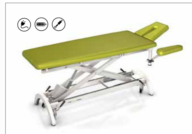
IMPULS-SERIE | ab S. 06